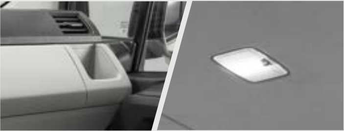
PORTA COPOS NO PAINEL Para motorista e passageiro

Imagens meramente ilustrativas. Consulte os equipamentos e especificações disponíveis em cada versão.