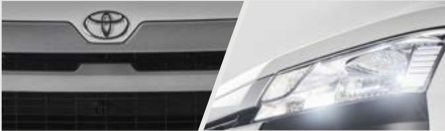
GRADE SUPERIOR DIANTEIRAS