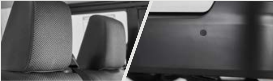
APOIOS DE CABEÇA Dianteiros e traseiros com regulagem de altura