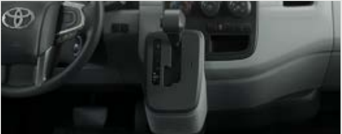
AUTOMÁTICA 6 Velocidades